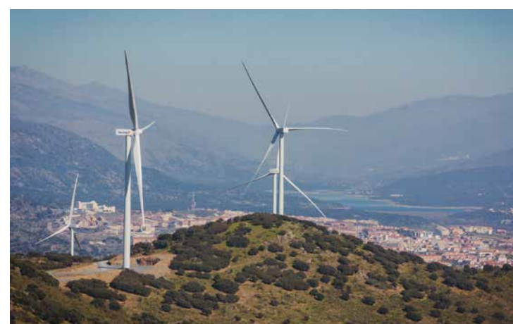
La apuesta local por las energías renovables es un fuerte compromiso del gobierno autonómico que ha calado profundamente tanto en la sociedad civil como en el tejido empresarial extremeño.

En este contexto, el gobierno extremeño compite por tener una gigafactoría. Fernández Vara está convencido de que el sector dará un cambio radical a la comunidad: “No hemos tenido petróleo, ni oro, pero tenemos la suerte de tener minerales como el litio, níquel, cobalto... Toda la cadena de valor del coche eléctrico hasta acoplar la batería empieza en la mina”, afirma. Extremadura también ofrece