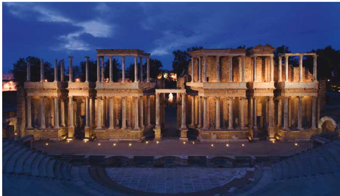
Mérida, capital de la Comunidad Autónoma de Extremadura, fue declarada Patrimonio de la Humanidad en 1993. Su teatro romano tenía capacidad de hasta 6.000 personas. En verano, alberga el Festival Internacional de Teatro Clásico.

La última apuesta emiratí por Extremadura se anunció en verano; es una azucarera en Mérida con el potencial de convertirse en la mayor inversión greenfield de EAU en España; 500 millones de euros. Una nueva conexión ferroviaria, recién licitada y con previsión de estar funcionando en un año, le servirá de enlace con los puertos españoles y portugueses. Fernández Vara cree que además de la agilidad administrativa —en seis meses el emiratí tuvo los trámites solucionados— y su propia disponibilidad personal, hay una parte emocional que captó al emiratí: “La grandeza del empresario que ve que su capital va a cambiarle el destino a un territorio y la estabilidad que dará a miles de agricultores.” La inversión estará cofinanciada por los fondos estructurales