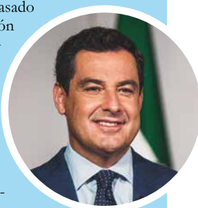
Juan Manuel Moreno Bonilla Presidente de Andalucía

“Nosotros los andaluces tenemos una sintonía cultural con el mundo árabe fruto de nuestro pasado común. Es la mejor carta de presentación para que vengan a invertir. Probablemente, en ningún sitio del mundo se van a sentir más cómodos y en casa como en nuestra tierra, Andalucía. Todo eso tiene que generar una confianza mutua y complicidad para sacar proyectos conjuntos. De nuestra parte vamos a poner el rigor, la seriedad y la seguridad jurídica. Cualquier inversión que se haga en Andalucía va a ser rentable y estable”.