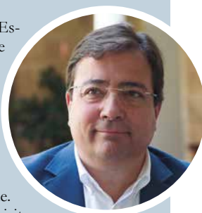
Guillermo Fernández Vara Presidente de la Junta de Extremadura

“Hay un lugar en el mundo en el sur de España, que se llama Extremadura, donde apreciamos mucho al pueblo árabe. Lo que somos y cómo somos —incluida nuestra posición pionera en energías fotovoltaicas— se verá el próximo febrero en EXPO 2020 Dubai. Pocas regiones del planeta tienen como nosotros tres ciudades patrimonio de la humanidad, tres reservas de la biosfera y un geoparque. Nos da un enorme valor. Será mi primer visita a EAU. Voy con la lógica curiosidad que despierta escuchar contar a los que de allí vienen la extraordinaria situación que encuentran”.