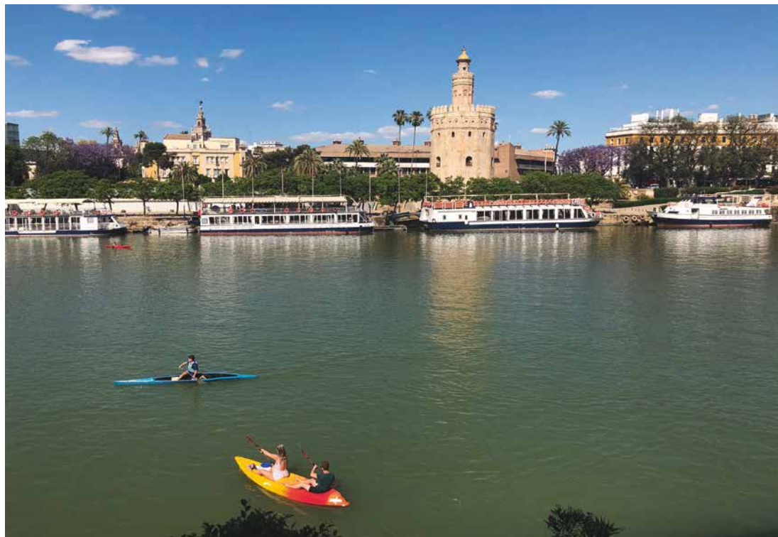
El Guadalquivir a su paso por Sevilla. Sus aguas riegan olivos, naranjos, arrozales y muchos otros productos agrícolas andaluces.