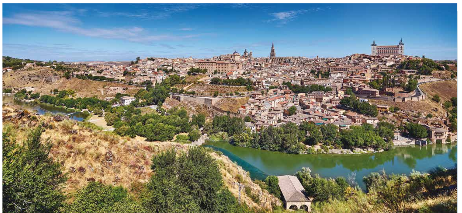
Toledo, capital de la Comunidad Autónoma de Castilla-La Mancha, fue durante siglos lugar de peregrinaje de sabios europeos en busca de conocimiento.

Unidad Aceleradora de Proyectos, que pone a disposición del inversor un equipo que hace el seguimiento de expedientes considerados estratégicos: “Que sea la Administración quien esté detrás del empresario y no al revés”.