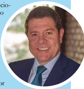
Emiliano García-Page Presidente de Castilla-La Mancha

“Valoro muchísimo que EAU haya pasado en tan poco tiempo de ser una sociedad tan tradicional a una moderna; no es fácil, ni con dinero de por medio. Tiene que ver con la capacidad de adaptación. Aunque durante décadas el petróleo será determinante, valoro que hayan tomado conciencia para vincular su riqueza a la diversificación dentro y fuera de su geografía. Significa una mentalidad muy global. Los países, ciudades y civilizaciones capaces de anticipar un cambio son inteligentes por definición”.